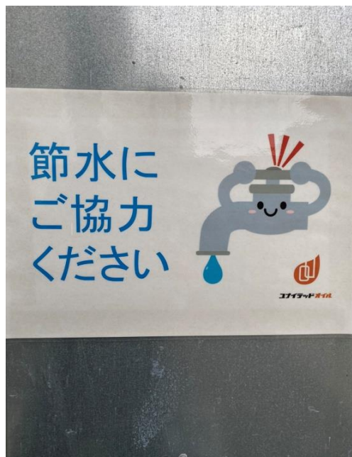
木場工場内の掲示の様子