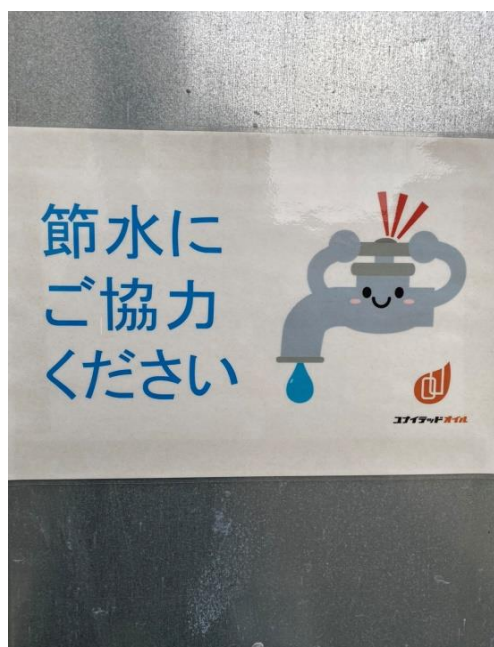
木場工場内の掲示の様子